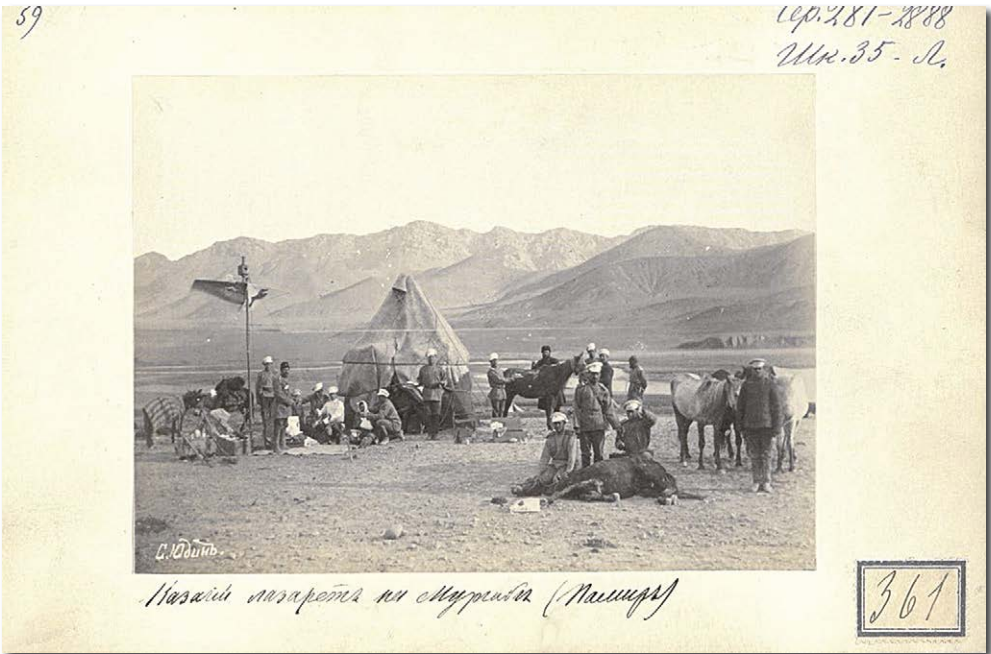
Рис. 7. Казачий лазарет на Мургабе (Памир). Fig. 7. "Cossack infirmary on Murgab (Pamir)".