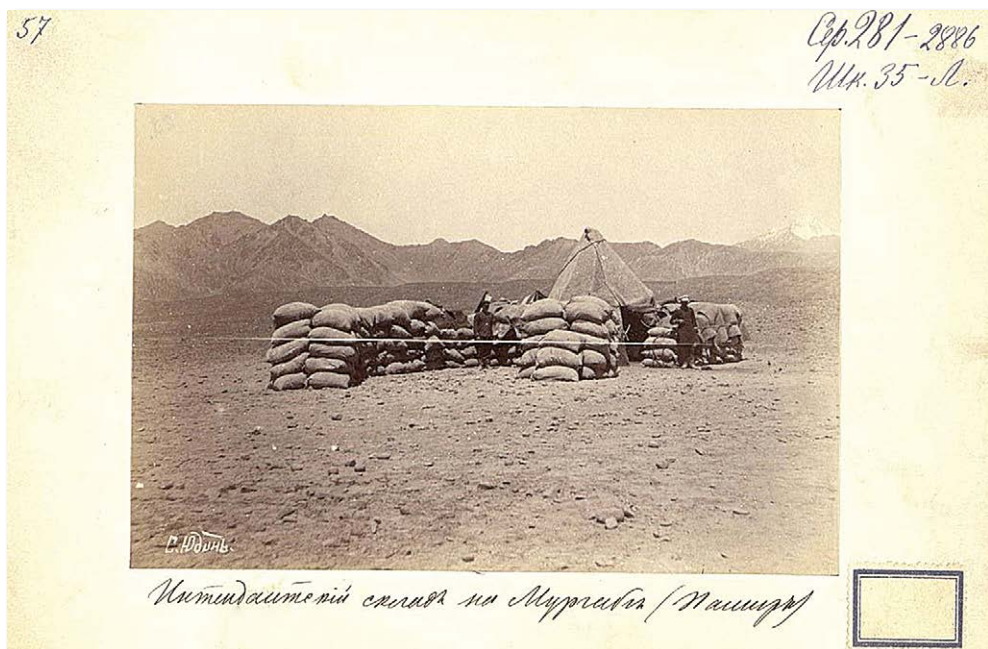
Рис. 6. Интендантский склад на Мургабе (Памир). Fig. 6. “Quartermaster warehouse in Murgab (Pamir)”.