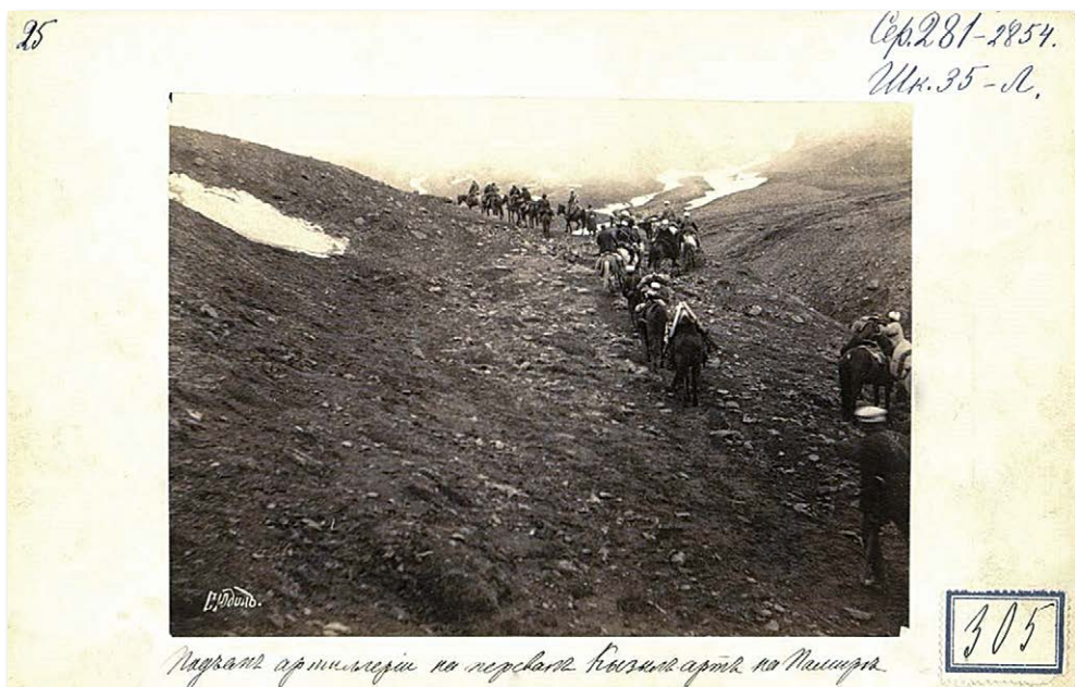
Рис. 3. Подъём артиллерии на перевал Кызыл-арт на Памире. Примечание: Перевал Кызыл-арт высотой 4280 м – ворота Памира со стороны Алайской долины. Fig. 3. "Moving the artillery towards the Kyzyl-art pass in the Pamirs." (The Kyzyl-art pass, 4,280 m high, is the gate of the Pamirs on the Alay Valley side of the range).