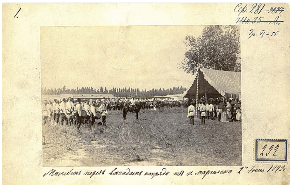
Рис. 1. Молебен перед выходом отряда из Нового Маргелана 2-го июня 1892 г.

Поход 1892 г. подробно и красочно описан одним из его участников – фотографом и писателем подпоручиком Б.Л. Тагеевым: «...Дорог не было, движение было крайне сложным, вследствие большого падежа вьючных животных была утрачена значительная часть боеприпасов и продовольствия. Однако, несмотря на все сложности, цели похода были достигнуты: отряд капитана А.Г. Скерского дошел до крайнего предела Памира – урочища Ак-таш, откуда выдворил обосновавшийся там китайский пикет. Таким образом, была установлена русская граница по Восточному Памиру. Она доходила до Сарыкольского хребта, т. е. до пределов бывших Кокандских владений» [13].