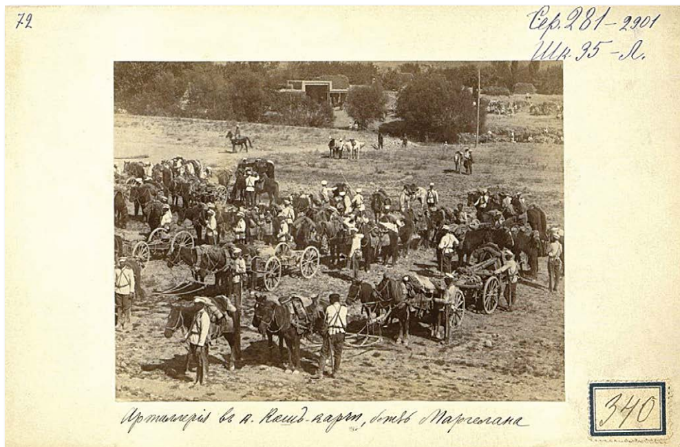
Рис. 2. Артиллерия в Кош-карчи, близ Маргелана. Fig. 2. "Artillery in Kosh-karchi, near Margelan."